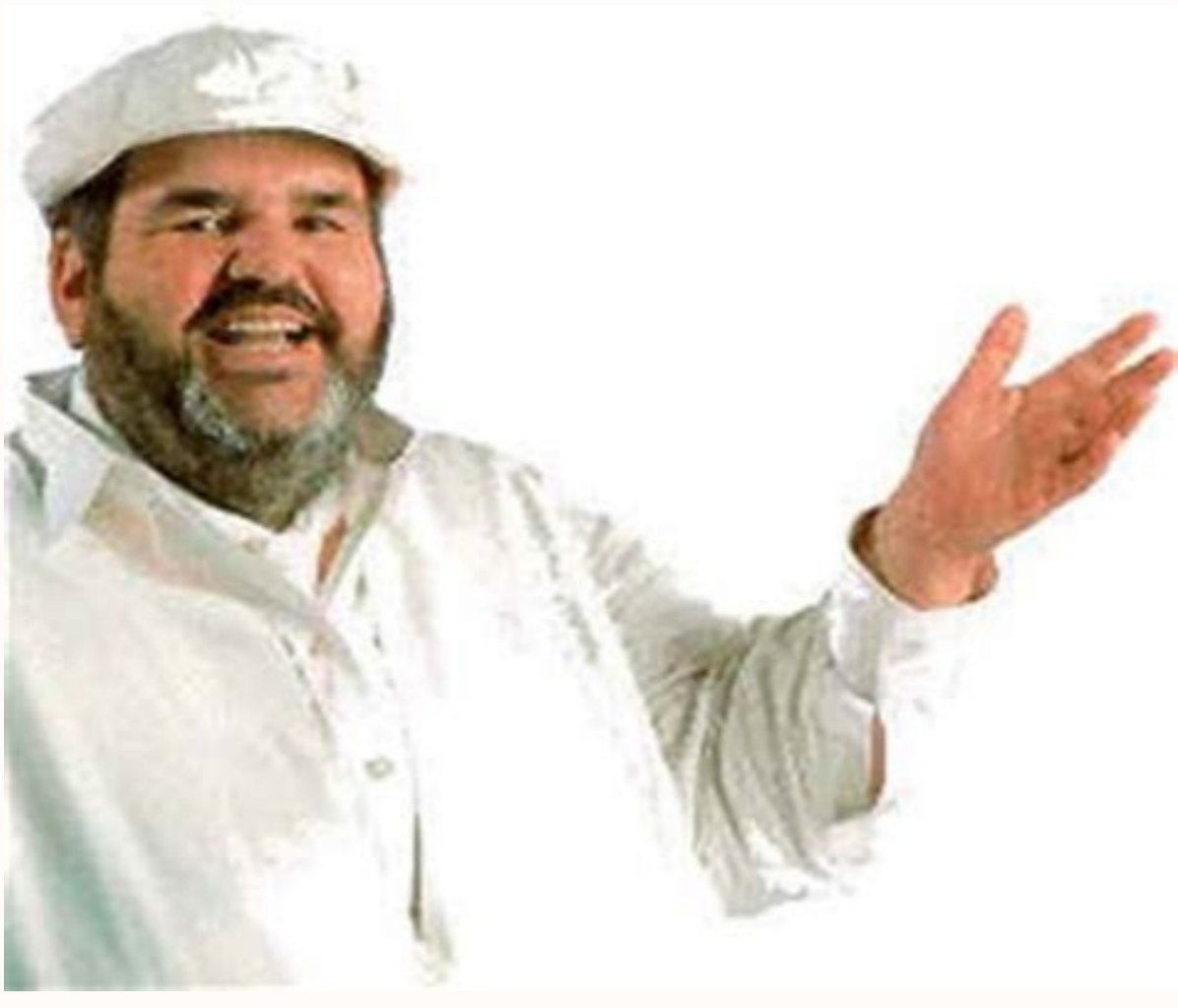
Chef paul prudhomme gumbo